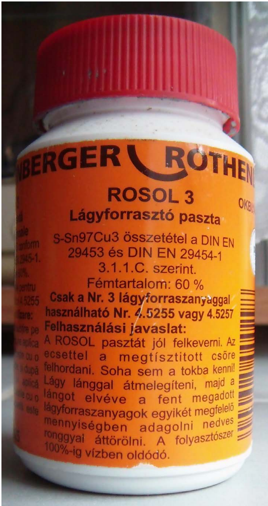
5. A paszta használati utasítása