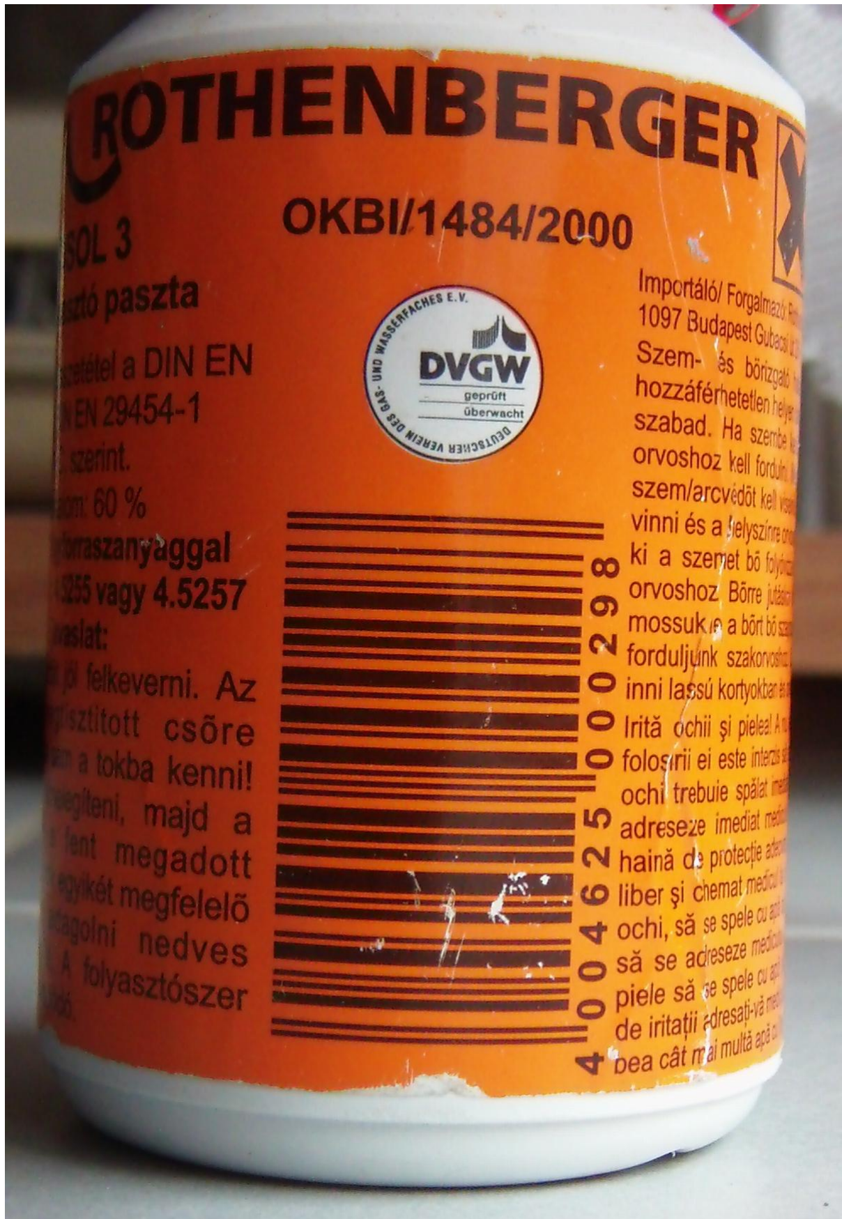
4. A paszta flakonja